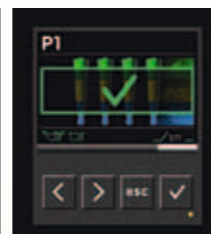
Prozess-Ende mit Erfolgsbestätigung.