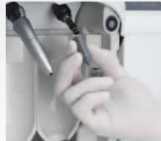
Spannzangen-Pflegeansatz auf MULTIflex Pflegekupplung aufsetzen.