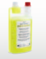
KaVo QUATTROclean Flasche