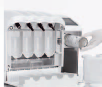
Pflege mit KaVo QUATTROoil.